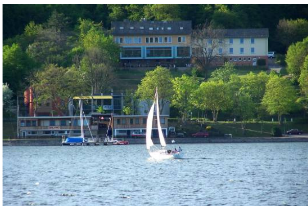
Blick vom See zur Herberge