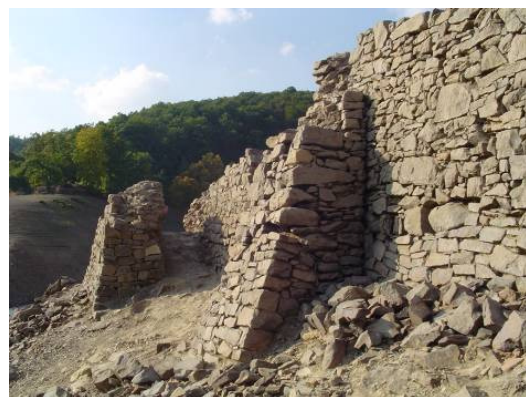
Niedrigwasser: Ruinen Klostermauer Dorf Berich