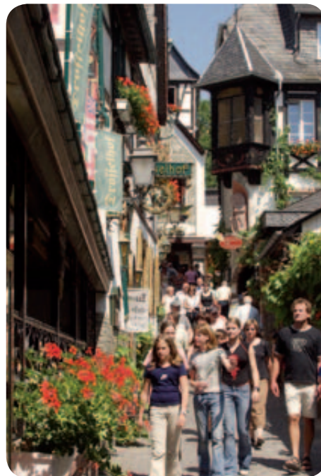
Die weltberühmte Drosselgasse

Über drei Millionen Besucher pro Jahr kommen nach Rüdesheim, um die berühmte Drosselgasse zu sehen und Rheinromantik zu genießen. Auch die Benediktinerinnenabtei St. Hildegard, Weingut und Kloster Eberbach in Eltville, die Ruine Brömserburg mit Weinmuseum und das Niederwald-Denkmal über der Stadt sind lohnenswerte Sehenswürdigkeiten. Ein Kuriosum ist das Musikinstrumentenmuseum im historischen Brömserhof. Wanderer schätzen besonders den Wanderweg „Rheinsteig“ entlang des UNESCO-Welterbes „Oberes Mittelrheintal“. Städtetouren nach Mainz, Wiesbaden und Frankfurt oder auch nach Bingen (Mäuseturm) sorgen für Abwechslung.