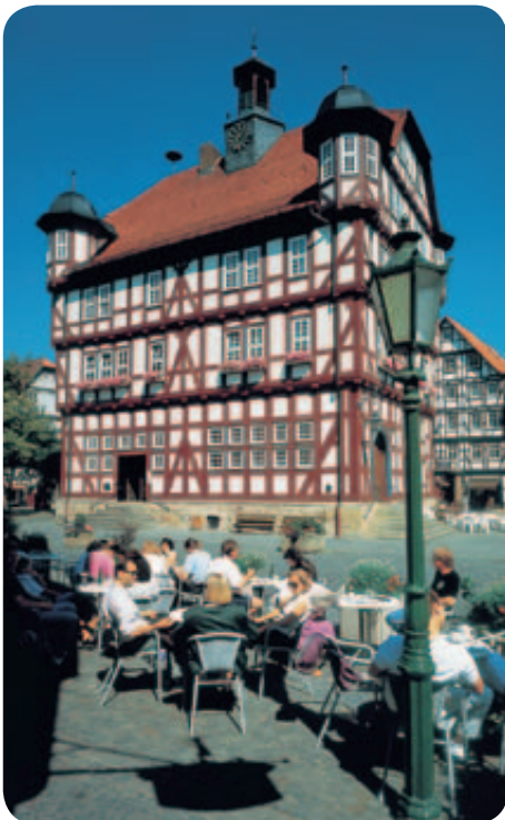
Historisches Rathaus Melsungen

Über 70 verschiedene Programme und Bausteine werden angeboten, die meisten mit durchgehender pädagogischer Begleitung.