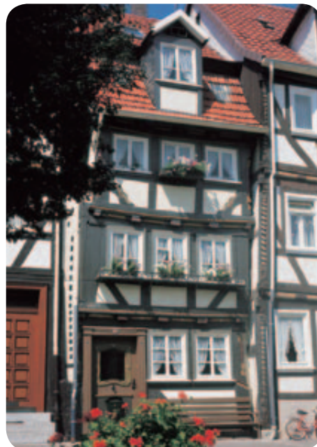
Fachwerkromantik in der Altstadt von Lauterbach

Das 50 km breite Vogelsberg-Massiv war erdgeschichtlich der größte Feuer speiende Vulkan Europas. Sein eher raues und feuchtes Klima sorgte dafür, dass die Höhen des Vogelsbergs wenig besiedelt wurden und heute einen nahezu unberührten Naturpark bilden. Von hier führen rund 150 km Wanderwege, zwei Fernradwege und der 74 km lange Vulkan-Radweg in den Hohen Vogelsberg. Das Gebiet um Taufstein (773 m, höchster Punkt des Vogelsbergs) und Hoherodskopf mit seinem Kletterwald ist für Wanderungen und Exkursionen besonders beliebt. Auch das Städtchen Lauterbach hat einiges zu bieten: Fachwerkhäuser, das Hohaus-Palais mit Museum, eine barocke Stadtkirche und das Burgschloss Eisenbach in der Umgebung. Für einen Ausflug eignet sich auch der Hochseilgarten Schlitz.